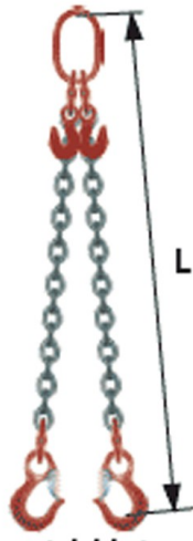
réglable à 2 crochets standards